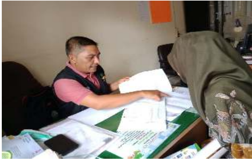
Wawancara bersama bapak ayen (Peksos kementrian RI)