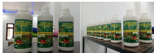
Gambar 2. Produk Pupuk Hijau Berkelanjutan yang Sudah di Kemasan

berbahan Organik di buat dengan bahanku alami dimana bahan utamanya memanfaatkan limbah-limbah yang dapat mencemari lingkungan seperti Limbah Ikan dan Limbah Cair Tahu. Selain itu di campur dengan bahan baku lainnya yaitu telur ayam ras, ajinomoto, dan air bersih. Produk Pupuk Hijau berkelanjutan dikemas didalam botol berukuran 500 ML sehingga dapat melindungi produk dari kerusakan dan juga menjaga produk agar tidak terkontaminasi dengan bakteri lain yang dapat merubah produk Pupuk Hijau Berkelanjutan.