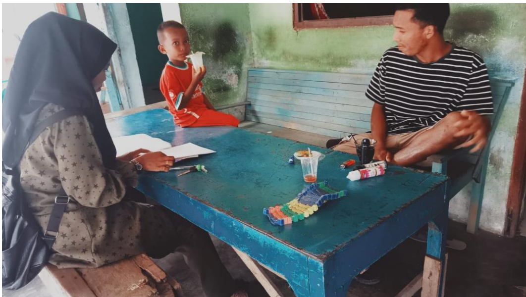
Wawancara cara dengan Nelayan PPI Kuala Tuha