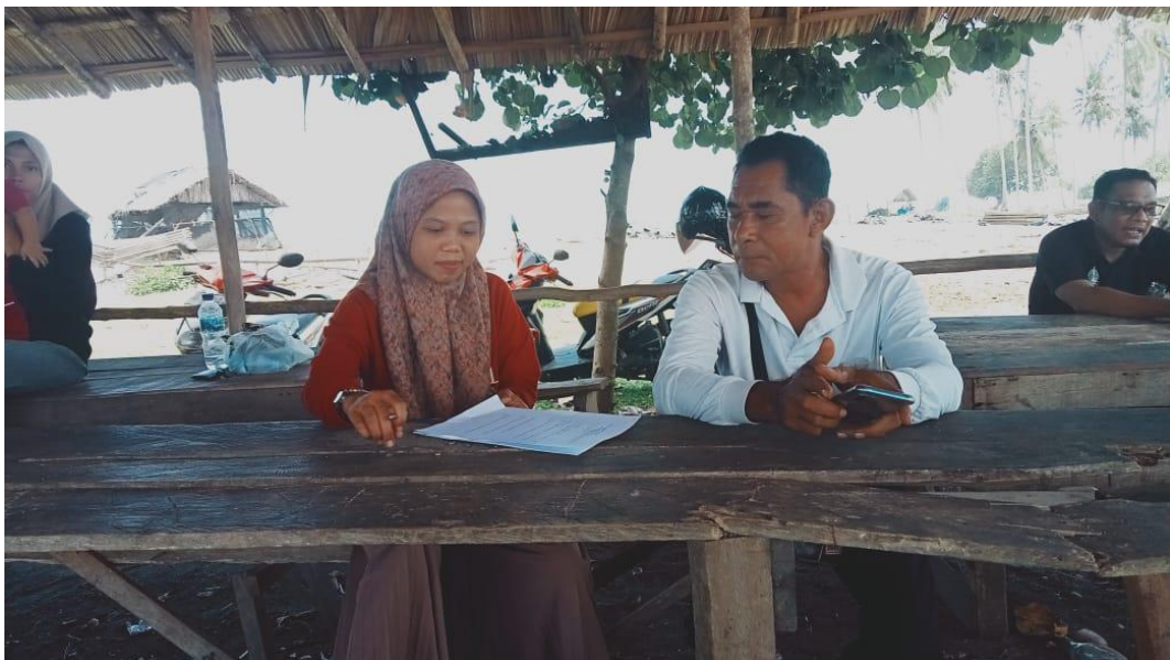
Wawancara cara dengan Nelayan TPI Tadu