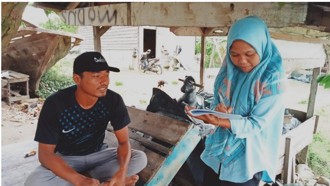
Wawancara cara dengan Nelayan PPI Kuala Tuha