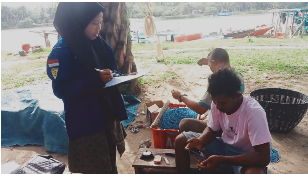
Wawancara cara dengan Nelayan PPI Kuala Tuha