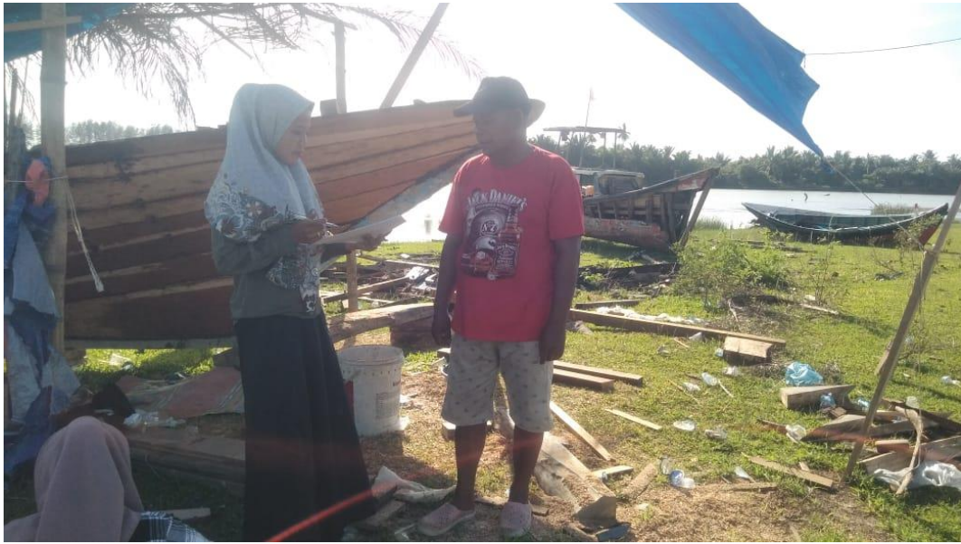
Wawancara cara dengan Nelayan TPI Tadu