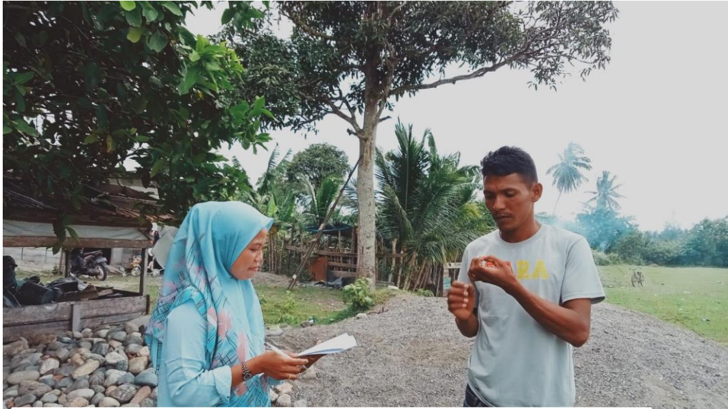
Wawancara cara dengan Nelayan TPI Tadu