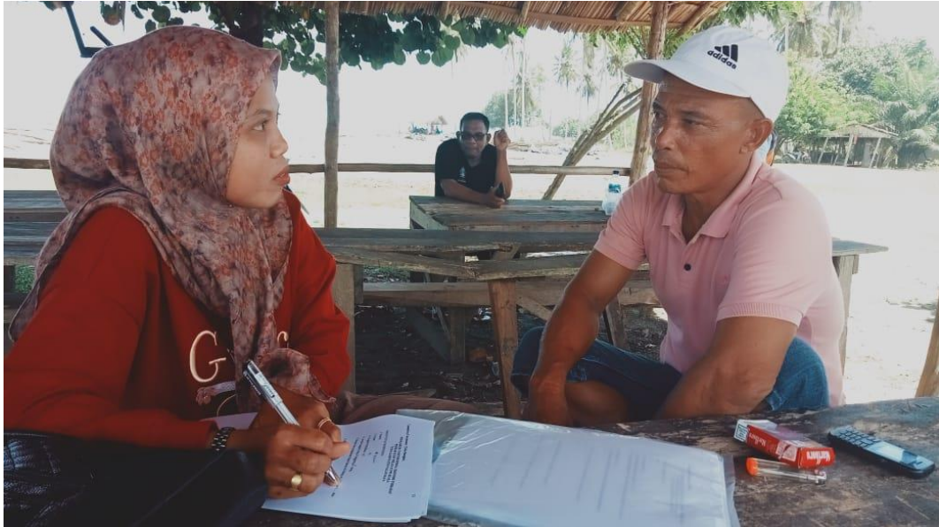
Wawancara cara dengan Nelayan TPI Tadu