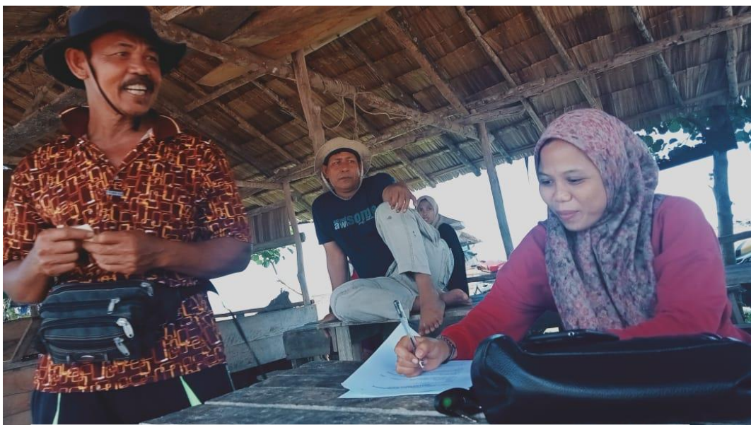
Wawancara cara dengan Nelayan TPI Tadu