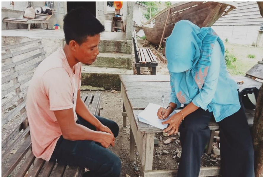
Wawancara cara dengan Nelayan PPI Kuala Tuha