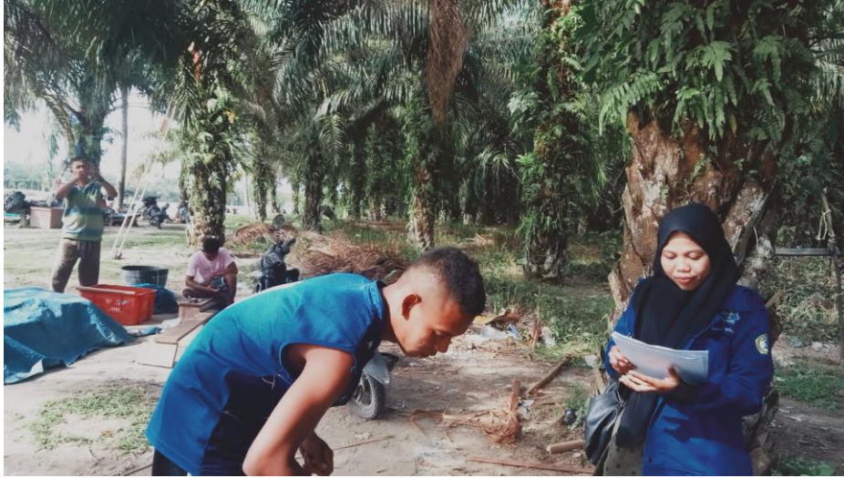
Wawancara cara dengan Nelayan PPI Kuala Tuha