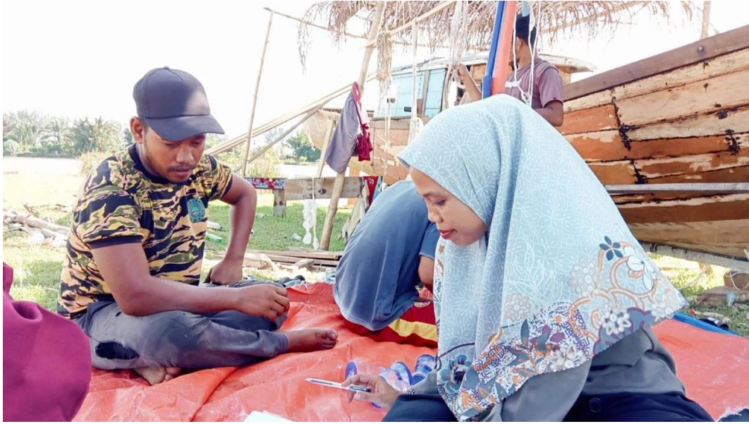
Wawancara cara dengan Nelayan TPI Tadu