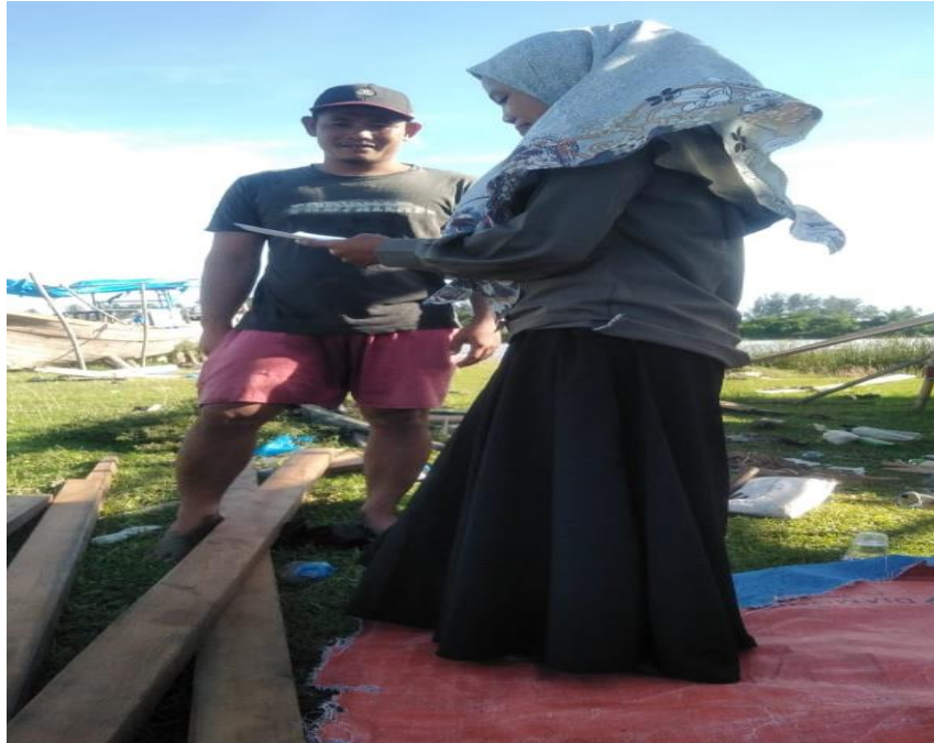
Wawancara cara dengan Nelayan PPI Kuala Tuha