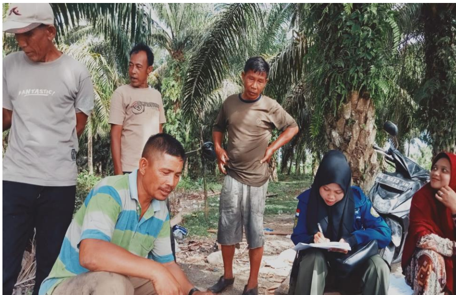
Wawancara cara dengan Nelayan PPI Kuala Tuha