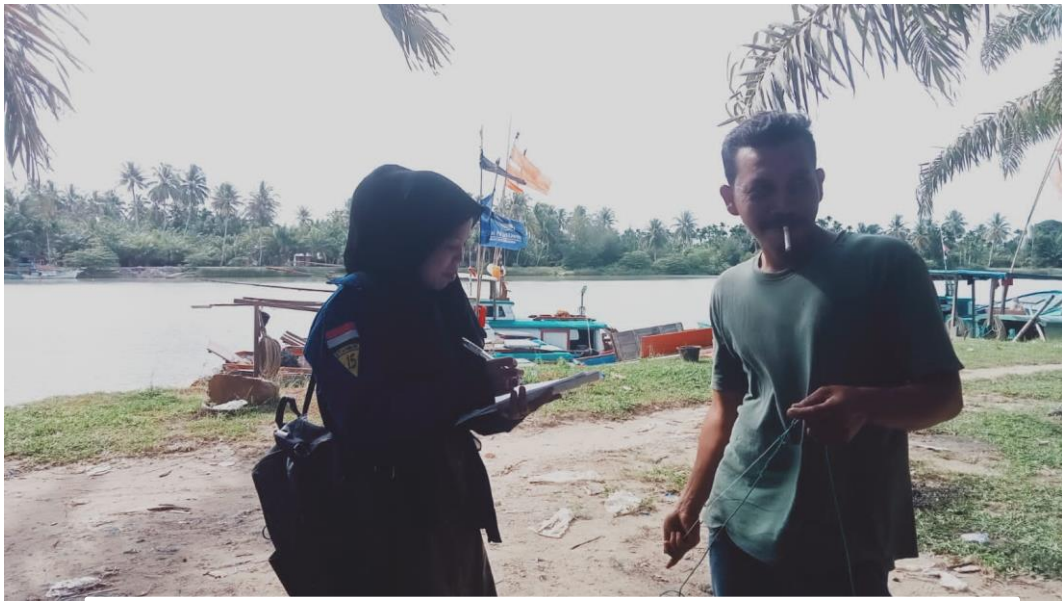
Wawancara cara dengan Nelayan PPI Kuala Tuha