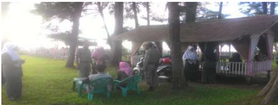
Gambar5 3 Pengawasan dan Pembinaan yang Di Lakukan oleh Anggota WH

Instansi pemerintah juga sangat mendukung terhadap pelaksanaan wisata syariat ini bisa dilihat dari upaya yang di lakukan seperti pengawasan dua kali dalam sehari, sosialisasi wisata syariat serta mempromosikan wisata syariat kepada wisatawan lokal dan wisatawan luar.