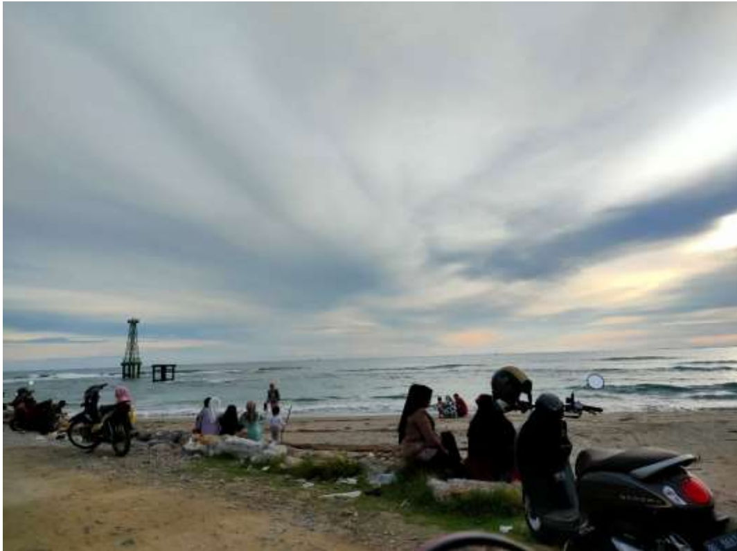
Gambar 5.2 Busana Wisatawan saat Berkunjung ke Tempat Wisata Kecamatan Susoh