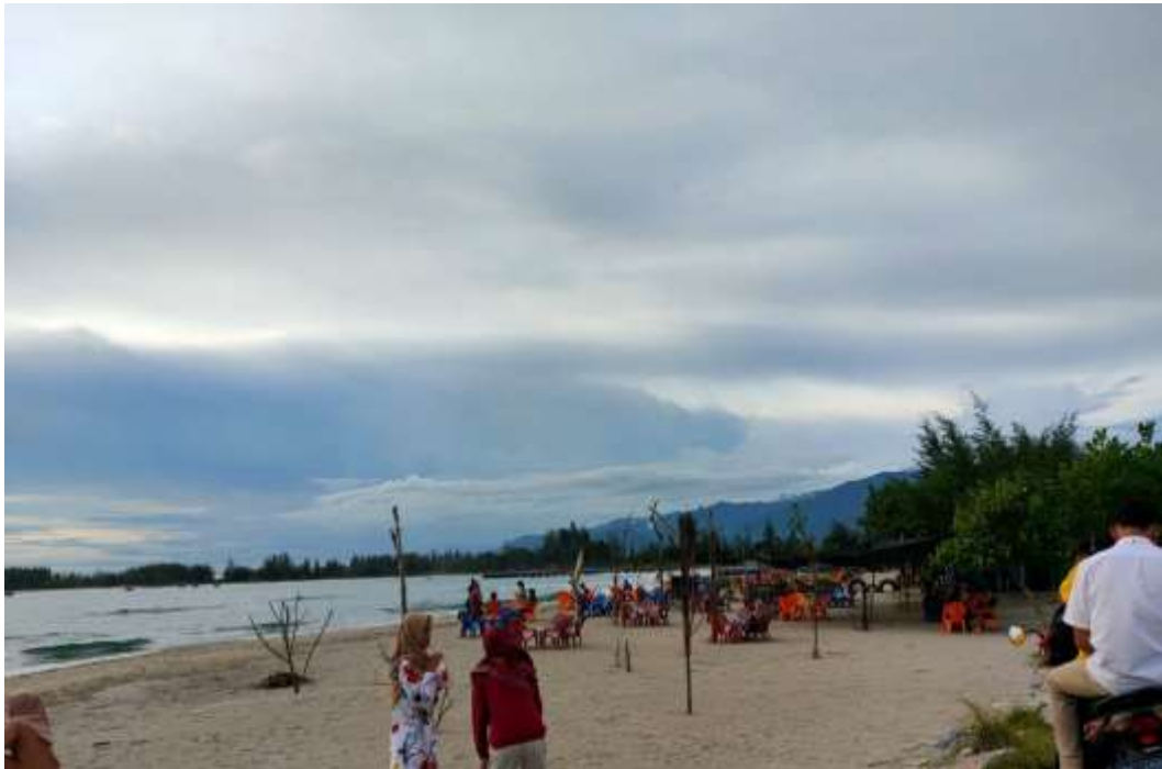
Gambar5 Isuasana Tempat Wisata di Kecamatan Aceh Barat Daya

Susoh hal ini bertujuan untuk meningkatkan perekonomian masyarakat setempat serta bisa meningkatkan devisa daerah.