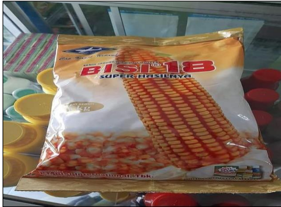
Gambar 7. Benih Jagung Bisi 18