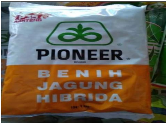
Gambar 9. Benih Jagung Pioneer