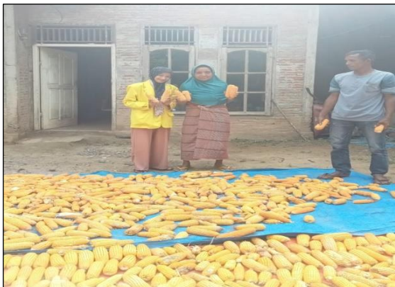
Gambar 3. Wawancara Peneliti Dengan Responden Penelitian