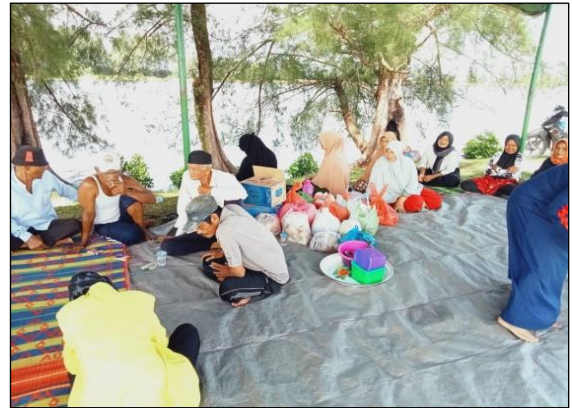
Gambar 2. Wawancara Peneliti Dengan Responden Penelitian