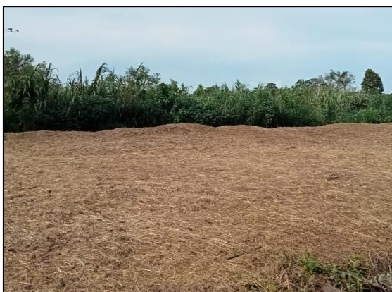
Gambar 5. Lahan Jagung Yang Sudah dibersihkan