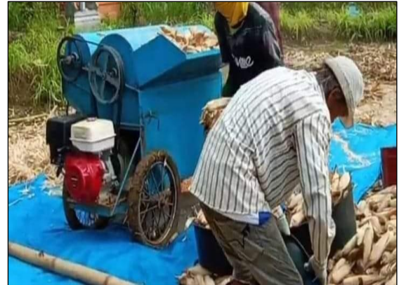
Gambar 8. Mesin Perentok Jagung