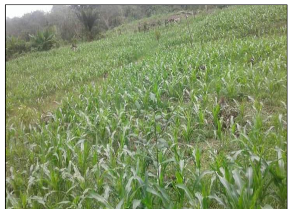
Gambar 6. Tanaman Jagung Umur Dua Minggu Setelah Tanam