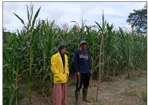
Gambar 4. Wawancara Peneliti Dengan Responden Penelitian