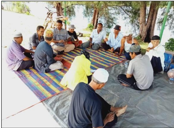
Gambar 1. Wawancara Peneliti Dengan Responden Penelitian