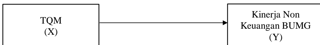
Gambar 2.1 Kerangka Pemikiran

Kerangka pemikiran adalah satu model yang menerangkan bagaimana hubungan suatu teori dengan faktor-faktor yang penting yang telah diketahui dalam suatu masalah tertentu. Kerangka pemikiran akan menghubungkan secara teoritis antara variabel-variabel penelitian yaitu variabel bebas dengan variabel terikat. Keterkaitan antara variabel independent terhadap dependent dapat ditunjukkan dalam bagan seperti dibawah ini :